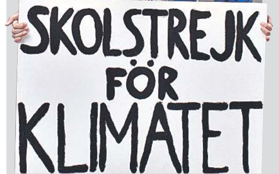
● Greta Thunberg Suediako parlamente kanpoaldean.