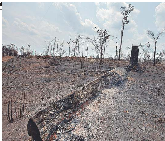
● Amazoniako iazko suteen osteko argazki bat, Brasilen.

Zientzialariek egindako aurreikuspenen arabera, itsasoaren maila